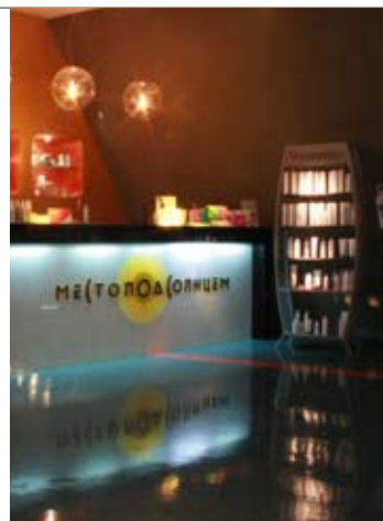
Холодное оружие (1)

ЛУЧШИЙ СПОСОБ ВЗБОДРИТЬСЯ В ДУШНОМ ГОРОДЕ - ПРОЙТИ КУРС КРИОТЕРАПИИ, ТО ЕСТЬ ЛЕЧЕНИЕ ХОЛОДОМ. С ПОМОЩЬЮ ЭТОЙ ПРОВЕРЕННОЙ И ДЕЙСТВЕННОЙ МЕТОДИКИ МОЖНО ДАЖЕ ЗА ОДНУ ПРОЦЕДУРУ ПРОДОЛЖИТЕЛЬНОСТЬЮ 30 МИНУТ ОЩУТИМО УЛУЧШИТЬ СОСТОЯНИЕ КОЖИ, ДОБИТЬСЯ ЗАМЕТНОГО ЛИФТИНГ ЭФФЕКТА, СНЯТЬ ОБЩУЮ УСТАЛОСТЬ И ИЗБАВИТЬ ОТ НАПРЯЖЕНИЯ В НОГАХ. МИНИ-СТРЕСС ПОЙДЕТ ОРГАНИЗМУ ТОЛЬКО НА ПОЛЬЗУ.